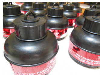
Radona elektrets 12