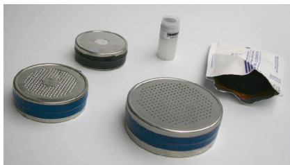
Radona ogles detektors 10

Ievērojot, ka radona līmenis mainās laikā un arī ir atkarīgs no sezonas, tad labākais risinājums ir izvietot detektorus mērīšanai ilgāku periodu (vismaz 6 mēneši), kas raksturo vidējo gada vērtību.