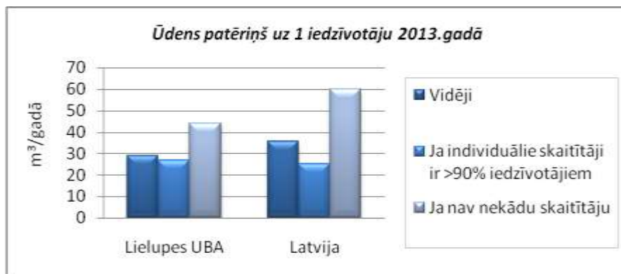
3.3.1.attēls. Samaksas par faktisko patēriņu pēc skaitītājiem ietekme uz iedzīvotāju ūdens patēriņu saistībā ar centralizētiem ūdensapgādes un kanalizācijas pakalpojumiem.

Piezīme: Ūdens patēriņš bez skaitītājiem noteikts, pamatojoties uz datiem no pakalpojumu sniedzējiem, kuriem nav nekādu skaitītāju visiem lietotājiem (iedzīvotājiem). Ūdens patēriņš ar skaitītājiem noteikts, pamatojoties uz datiem no pakalpojumu sniedzēju, kuriem vismaz 90 % lietotājiem (iedzīvotājiem) ir uzstādīti individuālie ūdens skaitītāji.